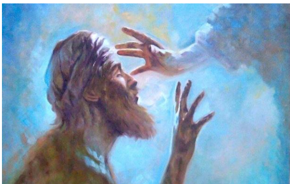
Genezing van de blinde

En de profeet Zacharia ziet Jeruzalem als een plaats van vrede, recht en spelvreugde.